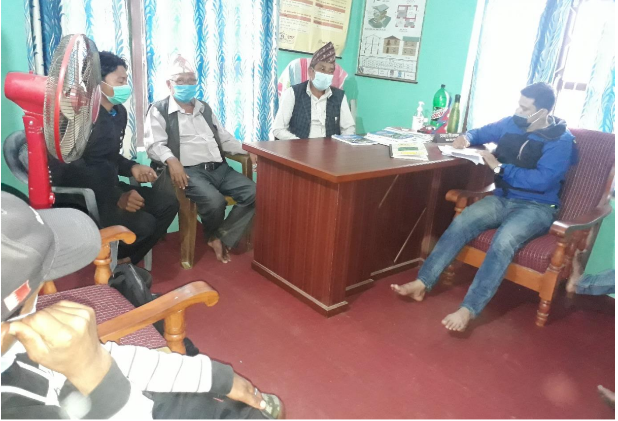
वडा नं. ५ भेला/छलफलमा सहभागीहरू