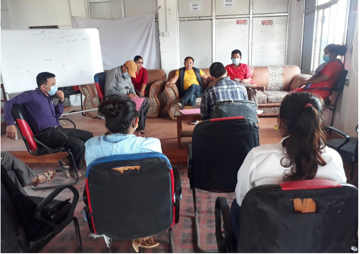
वडा नं. ७ भेला/छलफलमा सहभागीहरू