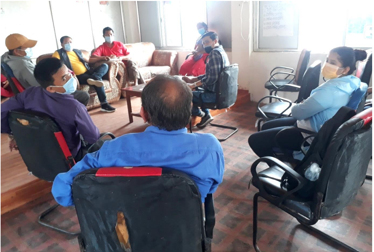
वडा नं. ६ भेला/छलफलमा सहभागीहरू