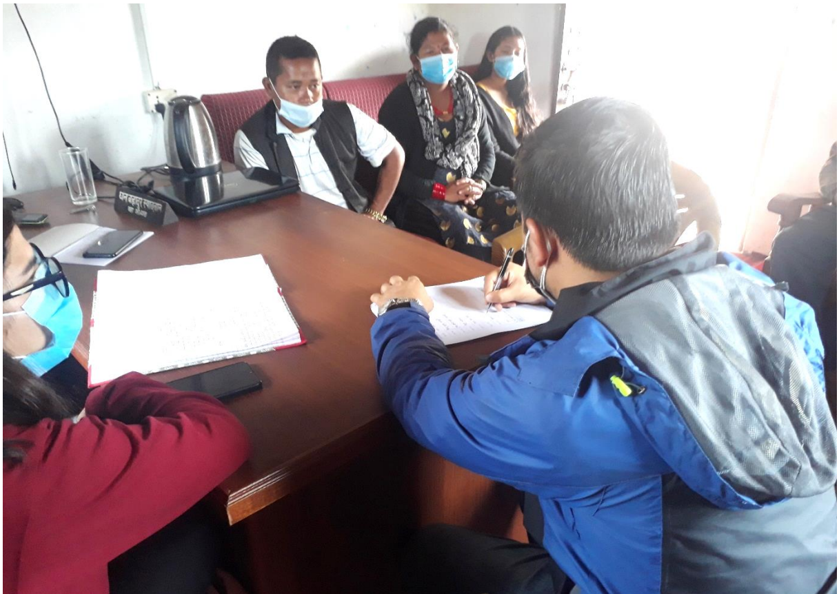
वडा नं. ४ भेला/छलफलमा सहभागीहरू