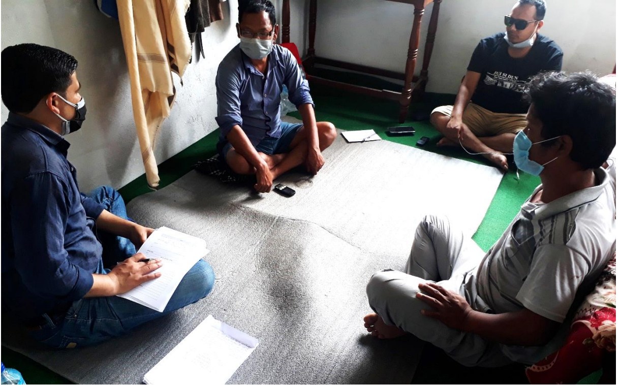
वडा नं. २ भेला/छलफलमा सहभागीहरू