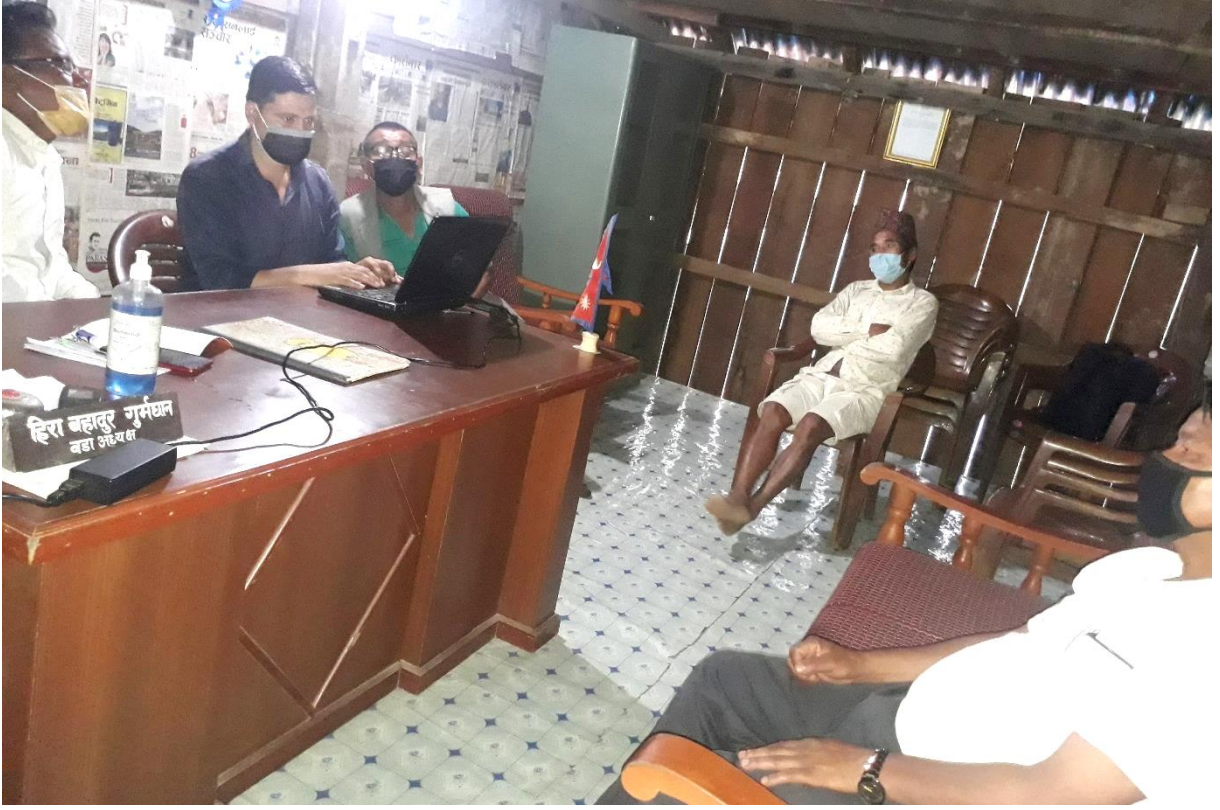
वडा नं. १ भेला/छलफलमा सहभागीहरू