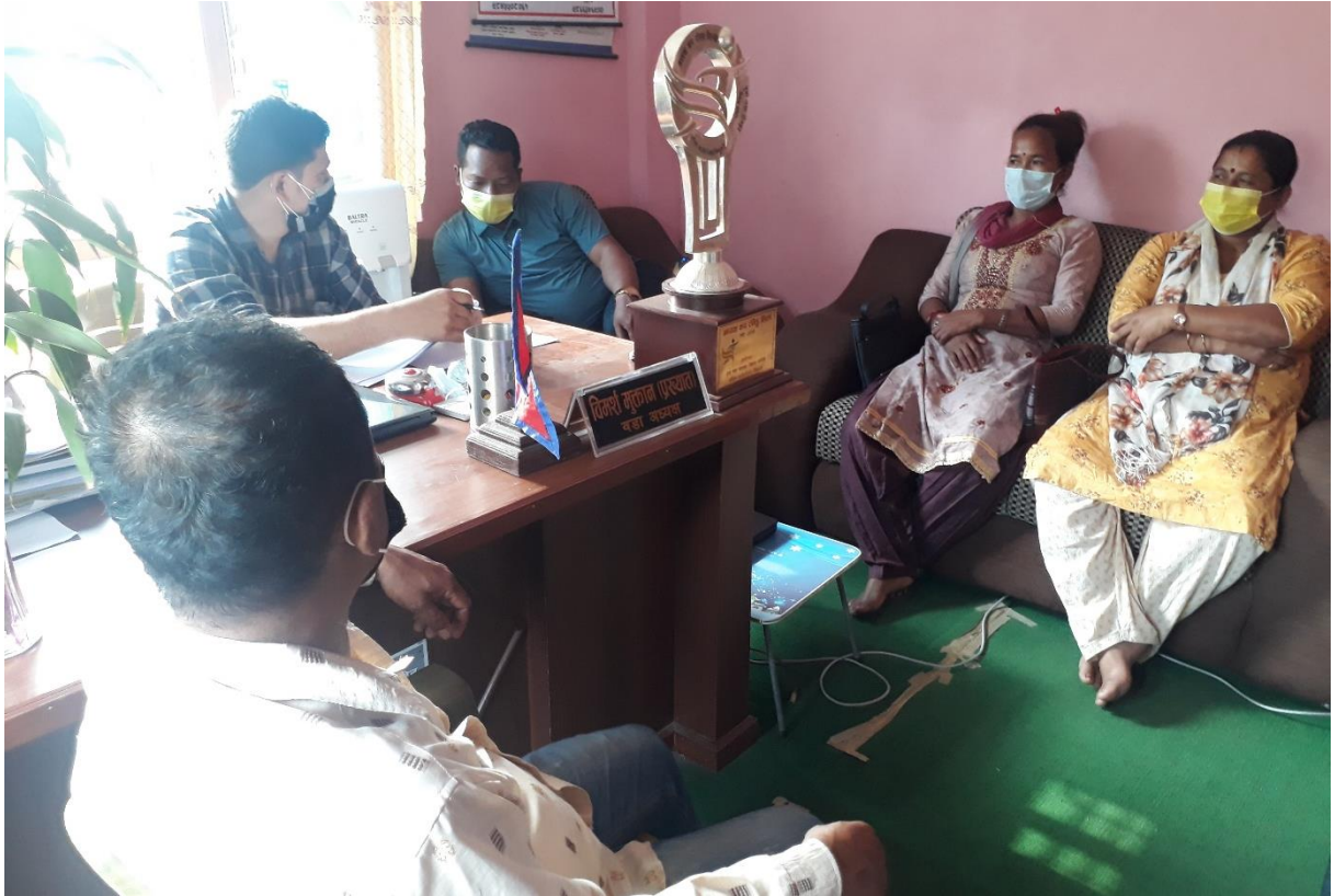
वडा नं. ३ भेला/छलफलमा सहभागीहरू