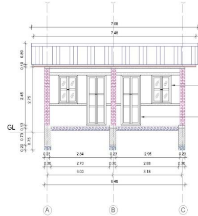
L-SECTION (FRONT SIDE) Janata Aawas Project Load Bearing Residential

Casement double panel aluminum windows with ventilation. Section size (54×33×1.50)mm, (38×34×1.50)mm & 5 mm glass.