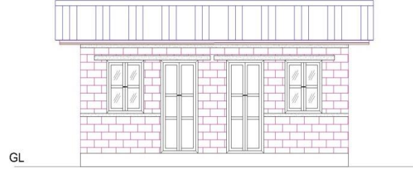
L-SECTION (FRONT SIDE) Janata Aawas Project Load Bearing Residential